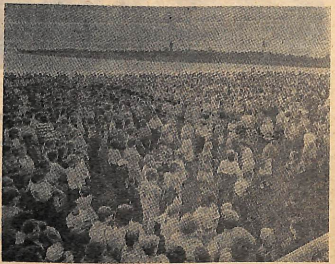
Так праздновался в городе День молодежи.